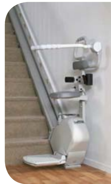
Modèle assis - debout

De fabrication robuste, Sonate est un monte-escalier élégant à la couleur discrète qui s'intégrera harmonieusement dans votre intérieur.