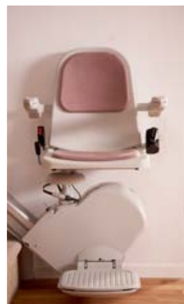
Sonate pour escalier droit