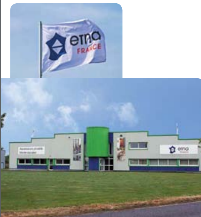
Usine Etna France en Normandie à Domfront (61-Orne), premier fabricant français d'ascenseurs privés et de monte-escaliers depuis 1986.